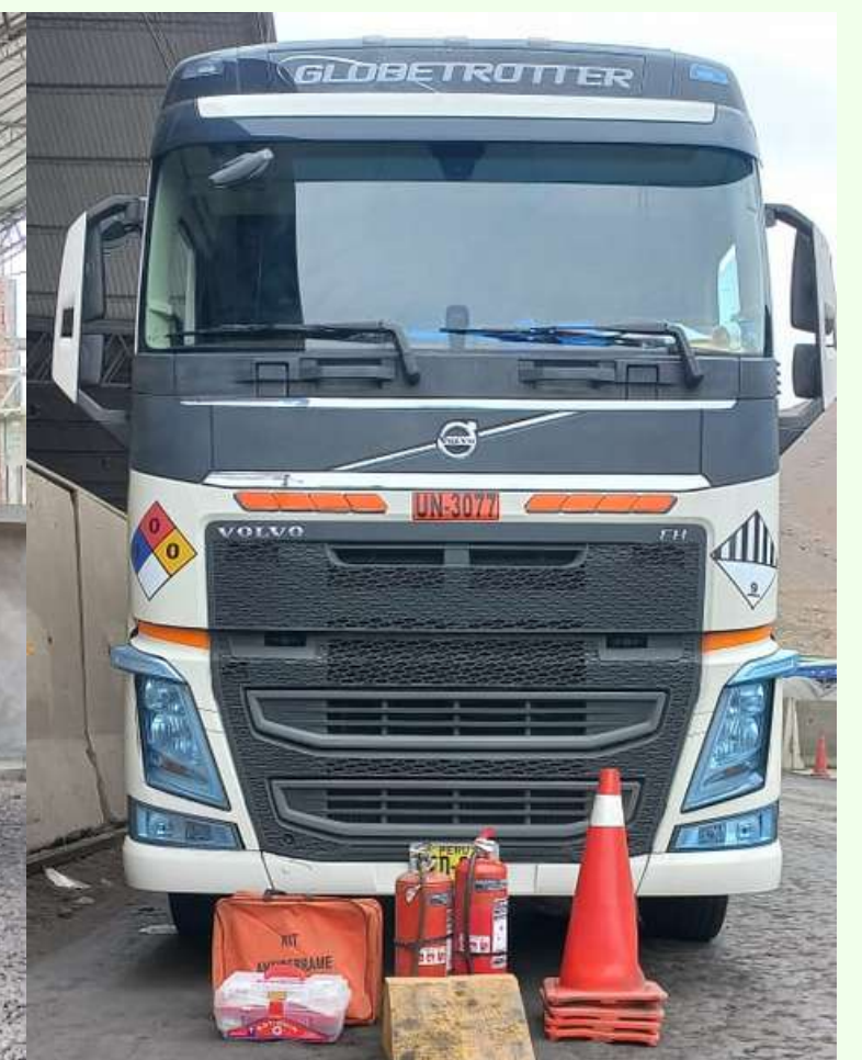
CAMION VOLVO FH AZD 684 - 25 TN - ENCAPSULADO